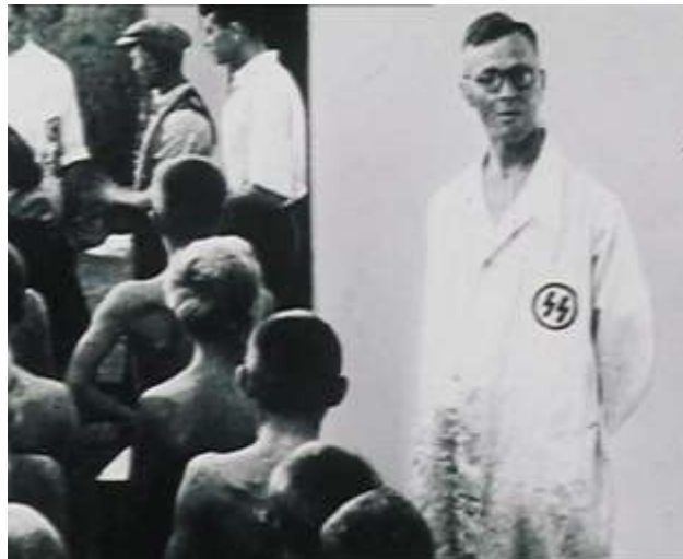
Les médecins dans le national-socialisme. Le chapitre le plus sombre de l'histoire de la médecine allemande. Et aujourd'hui encore ?

Des médecins, des « experts » et des psychologues volontaires sont au service de l'enlèvement d'enfants moralement répréhensible par les tribunaux du « Jugendamt » et de la famille. Pour la plupart, c'est une très bonne affaire. Beaucoup de personnes concernées comparent cela au pédophile national-socialiste Dr Josef Mengele. De mai 1943 à janvier 1945, Mengele est employé comme médecin de camp dans le camp de concentration d'Auschwitz-Birkenau. À ce titre, il effectuait des sélections, supervisait le gazage des victimes et menait des expériences médicales inhumaines sur des prisonniers et en particulier sur des enfants. Comme c'est le cas aujourd'hui, les auteurs n'étaient au courant d'aucune culpabilité. Ne rien savoir ou ne pas obéir aux ordres est l'excuse la plus courante. L'Association régionale de Rhénanie vient d'autoriser un acte spécial de brutalité pour le traitement administratif d'un enlèvement d'enfant par le « Jugendamt » de Bergisch Gladbach. La psychologue,