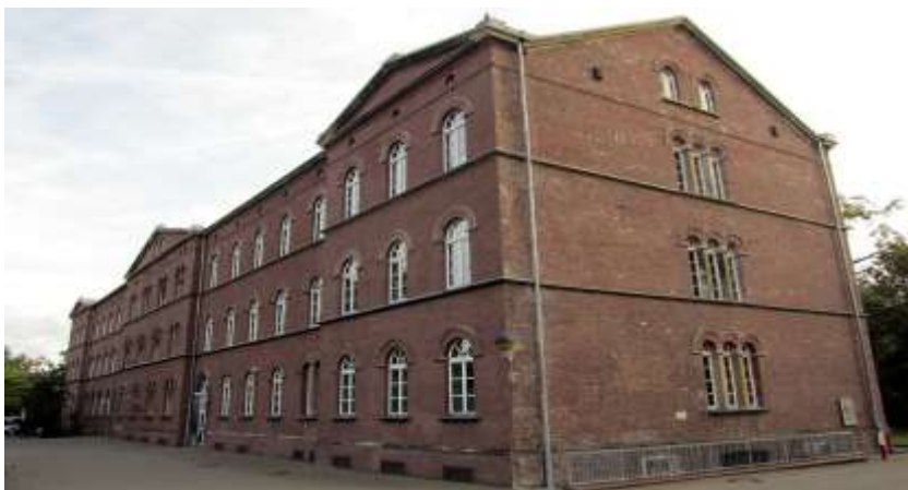
Mémorial Brauweiler du LVM L'utilisation du lieu de travail par la police secrète d'État – la RPL d'hier et d'aujourd'hui ?

Bonjour à toutes les dames et messieurs des cliniques LVR de Bonn et du service de presse de LVR,