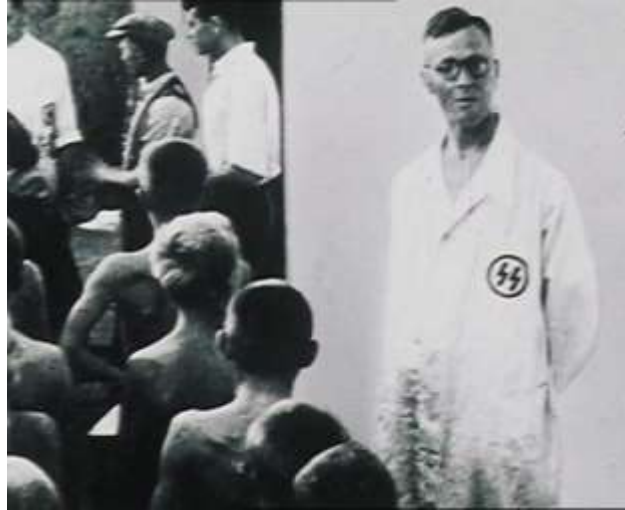
Nasyonal Sosyalizmde Doktorlar. Alman tıbbi tarihinin en karanlık bölümü. Ve bugün yine mi?

Gönüllü doktorlar, "uzmanlar" ve psikologlar, "Jugendamt" ın ve aile mahkemelerinin ahlaki açıdan kınanması gereken çocuk kaçırma olayına hizmet ediyor. Çoğu için, bu gerçekten iyi bir anlaşma. Etkilenenlerin çoğu bunu Nasyonal Sosyalist çocuk tacizcisi Dr. Josef Mengele ile karşılaştırıyor. Mayıs 1943'ten Ocak 1945'e kadar Mengele, Auschwitz-Birkenau toplama kampında kamp doktoru olarak çalıştı. Bu sıfatla seçimler yaptı, kurbanların gazla öldürülmesini denetledi ve mahkumlar ve özellikle çocuklar üzerinde insanlık dışı tıbbi deneyler yaptı. Bugün olduğu gibi, failer herhangi bir suçun farkında değildi. Hiçbir şey bilmemek veya emirlere göre hareket etmemek yaygın bir bahanedir. Bergisch Gladbach "Jugendamt" tarafından putian bir çocuk kaçırma olayının idari olarak ele alınması için özel bir vahşet eylemi şimdi Rheinland Bölge Birliği tarafından sağlandı. LVR