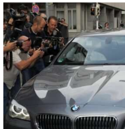
Kesi ya Kachelmann na ofisi ya mwendesha mashtaka wa umma ya Mannheim: Kachelmann mbele ya kamera "Mimi sina hatia" Aliachiliwa huru baada ya miezi kadhaa ya kizuizini kabla ya kesi.