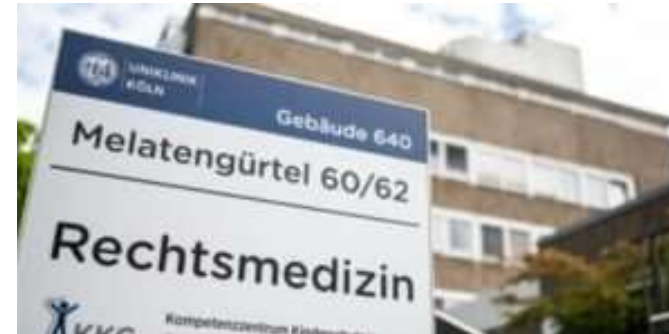
Medicina forense en Colonia

vivido "tiempo gris" de 1933 –los elitistas retrógrados de hoy, los recalcitrantes y siempre afirmativos sistemáticamente relevantes en las oficinas, que deberían conocer el código penal–, pero como todo lo que es la voluntad del pueblo, ignorando constantemente, incluso peleando, al igual que los supuestos "derechistas" a los que acusan de hacer precisamente eso.