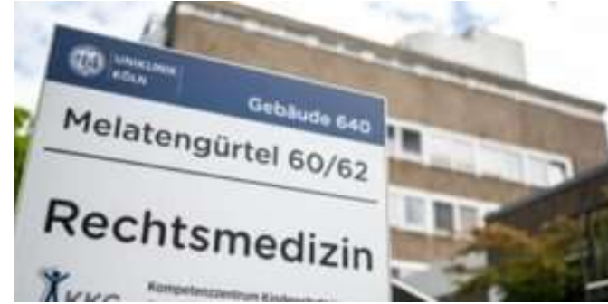
Köln'de Adli Tıp

YAZAR: Heinz Faßbender 17 Mayıs 2024 Okuma süresi 8 dak.